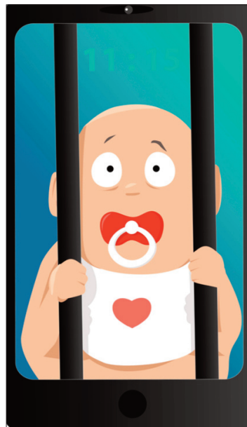
La vetrinizzazione e la limitazione della libertà del bambino

Nel breve periodo, la condivisione di informazioni sulle identità digitalizzate può inoltre facilitare i reati informatici legati ai furti di identità (quando l'autore del reato utilizza le informazioni personali ottenute per impersonare una o più vittime in un periodo di tempo che va da ore ad anni) e alle frodi di identità (si pensi ad esempio a molte frodi bancarie), nonché una serie di reati informatici legati alla persona, esponendo i minori ad attenzioni indesiderate.