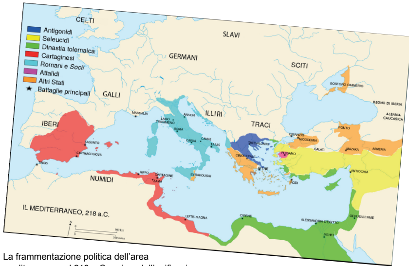
La frammentazione politica dell'area mediterranea nel 218 a.C., prima dell'unificazione, conseguenza delle conquiste romane. Mappa disponibile sotto una licenza Creative Commons CC0 1.0 Universal e disponibile nell'originale all'indirizzo https://commons.wikimedia.org/wiki/Image:218aC_mappa_del_mar_Mediterraneo.png?uselang=it

e mondo cinese, fino ad anni recenti, sono stati relativamente rari (tra i primi tentativi di analisi organica Gizewski 1994), soprattutto in confronto alle numerose indagini, che sono state dedicate ai contatti tra i due imperi, sebbene tali contatti siano stati sporadici: un accento che forse discende dall'innegabile fascino che i pur rari contatti tra i due imperi suscitano, ma anche dalle oggettive difficoltà che la storia comparativa presenta.