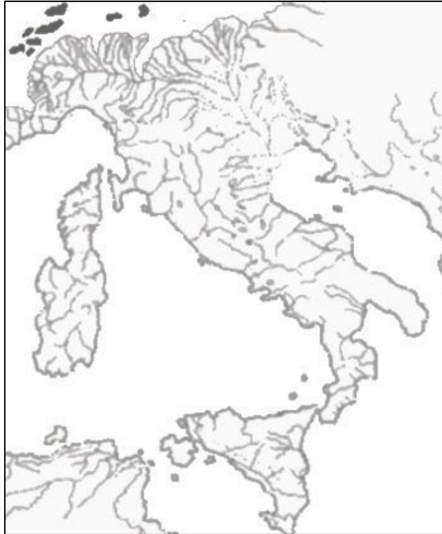
L'attuale penisola italiana durante l'apice glaciale (da Ehlers - Gibbard [2004]).

Era l'epoca, per intendersi, in cui le popolazioni dell'attuale Europa mediana, cioè dell'Europa settentrionale di allora, non guardavano al mare come al loro limite verso Nord, ma a una sterminata linea di ghiacci, e in cui il paesaggio, anche nell'attuale penisola italiana, era un'immensa tundra intervallata da calotte di ghiaccio e rilievi ghiacciati (Ehlers - Gibbard [2004]). La Pianura Padano-veneta, per fare un esempio, continuava nell'Adriatico settentrionale, che non era ancora un mare, e le lingue glaciali – lunghe anche 70 km. – percorrevano in senso longitudinale il territorio in cui si trovano attualmente l'Emilia, la Toscana, l'Abruzzo; tracce di enormi ghiacciai sono copiose anche per la Corsica, dove essi coprivano gran parte dell'isola (cfr. Riccardi [1978: 48-50]).