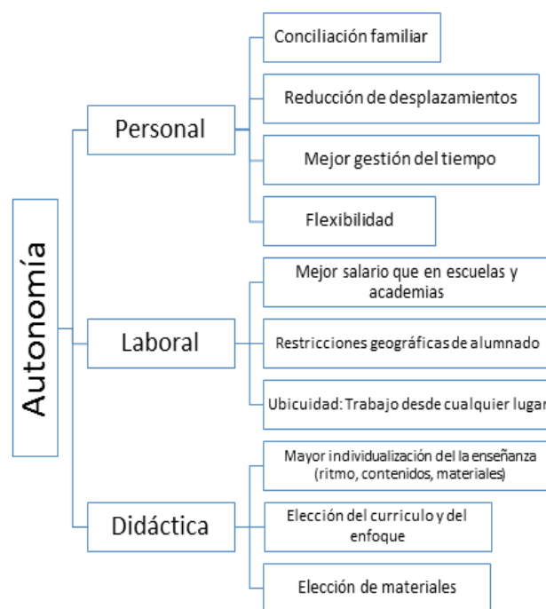
Figura 2. Ventajas de la enseñanza en línea.

Desde el punto de vista laboral, el profesorado es libre de elegir su horario de trabajo, pero también cuánto cobra por él, algo que, a pesar de la estacionalidad referida por algunos informantes, ofrece un complemento para muchos profesores que combinan la modalidad en línea con la presencial. En algunos casos, se afirma que la remuneración económica es mayor, véanse las respuestas: «Más práctico, mejor pagado, más moderno» (informante 13); «Ingresos superiores» (informante 54). Esto se debe probablemente a que, al evitar intermediarios, el sueldo neto sea más elevado. En este sentido, varios informantes asocian la autonomía y flexibilidad a la capacidad de decidir cuánto cobrar por las clases: «Gestión del tiempo y los ingresos» (informante 13); «soy mi propia jefa, decido precios y puedo trabajar desde cualquier lugar» (informante 17). Por último, sorprende constatar que esta modalidad ofrece una ventaja que no se había previsto, esto es, evitar el acoso en ámbito laboral, una de las informantes (84) escribe: «Como profesora, al ser mujer, no corro ningún riesgo de acoso, en las presenciales ya me ha pasado algunas veces».