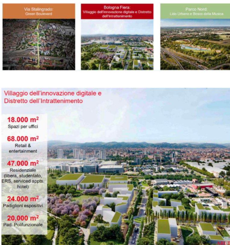
Fig. 4 Primavera dell'urbanistica, progetto TEK district.