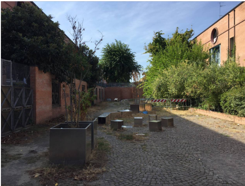
Fig. 2 Palestra di fortuna nelle case popolari.

convention di immobiliari che reali aperture di confronto, attraverso interventi ingenti che se dovessero mai vedere la luce cambierebbero volto all'intera città. Nessuna traccia di processi partecipativi, di resoconti riguardo i laboratori di quartiere; scompaiono post-it e assemblee con facilitatori. La questione di merito invece attiene al contenuto di queste progettualità che sembrano disancorate rispetto al contesto urbano e soprattutto restituiscono un'idea di sviluppo che fa sembrare molto attuale la visione di città come growth machine di Logan e Molotch (1987). In sintesi, il tentativo attuato dalla narrazione del Comune sembra essere, da un lato, quello di smontare ciò che sopravvive degli strumenti urbanistici, per facilitare un'evoluzione dello spazio urbano sempre più finalizzata a veicolare interessi privatistici e di messa a valore, come si evince anche dal coinvolgimento emblematico di figure apicali come l'archistar; dall'altro, risolvere le tensioni sociali attraverso una partecipazione che non è confronto ma simulazione del conflitto, volta ad annichire il conflitto stesso, essenza di ogni società democratica. Una partecipazione che, sempre più diluita, finisce poi per uscire definitivamente di scena, sepolta dalla versione della città inclusiva e cognitiva.