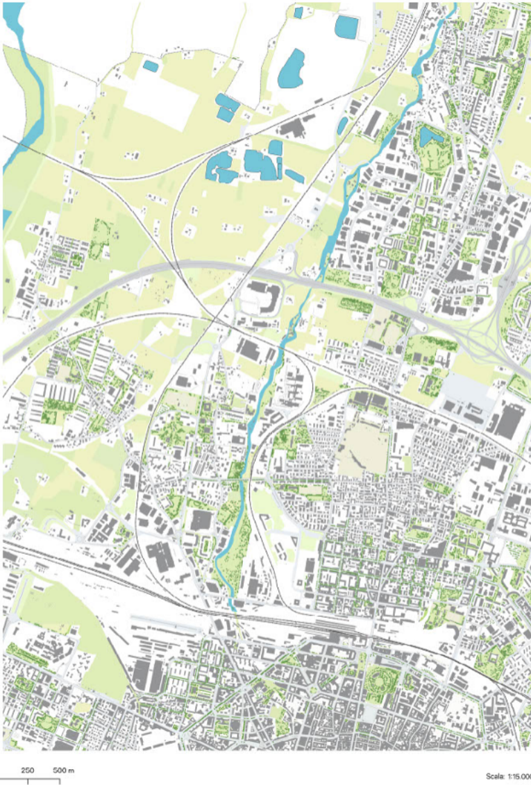
Fig. 3 Ambito territoriale "Lungo Navile".